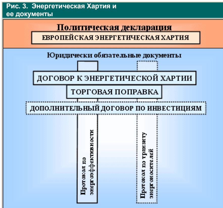
Рис. 3. Энергетическая Хартия и ее документы

Начатые в 2000 г. переговоры по Протоколу по транзиту в соответствии с решением июньской конференции по Энергетической Хартии должны завершиться в декабре нынешнего года - вне зависимости от их исхода. Конференция выразила понимание, что окончательное согласие сторон потребует пакетного компромисса, для выработки которого понадобится серия двусторонних консультаций основных заинтересованных участников переговоров, в первую очередь - двусторонние консультации Россия - ЕС, ибо именно между этими делегациями сохраняется пока наибольшее число разногласий, в частности, по таким вопросам, как(не)ограниченность применения "права первого отказа", допустимость аукционной формы определения транзитных тарифов и - главное разногласие - применимость "интеграционной поправки ЕС" (иначе: Положения об Организации региональной экономической интеграции) 6 .