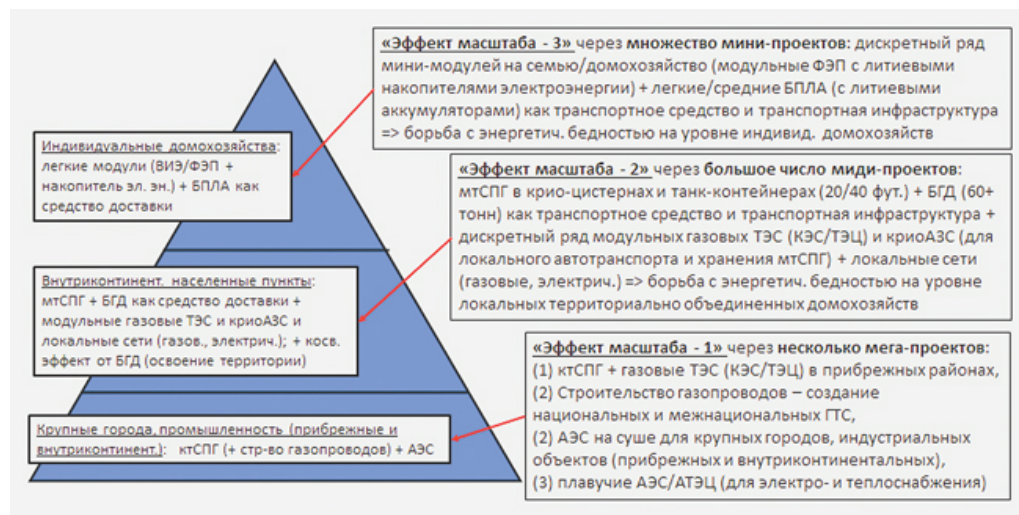
Три уровня энергетической интеграции в рамках БРИКС+: пирамида энерготехнологической кооперации для России со странами глобального Юга. Схема автора

Эта же модель после апробации в российских условиях может быть использована для энергообеспечения обширных территорий Евразии, дополняя и интегрируя сеть существующих и проектируемых газопроводов и портовых терминалов крупнотоннажного СПГ (ктСПГ), формируя тем самым большое евразийское энергетическое пространство (БЕЭП) в развитие выдвинутой президентом РФ в 2015 году философии Большого евразийского партнерства (БЕП), которое ныне является частью внешнеполитической доктрины РФ.