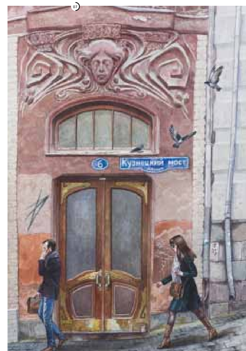
°1 Алена Дергилева.