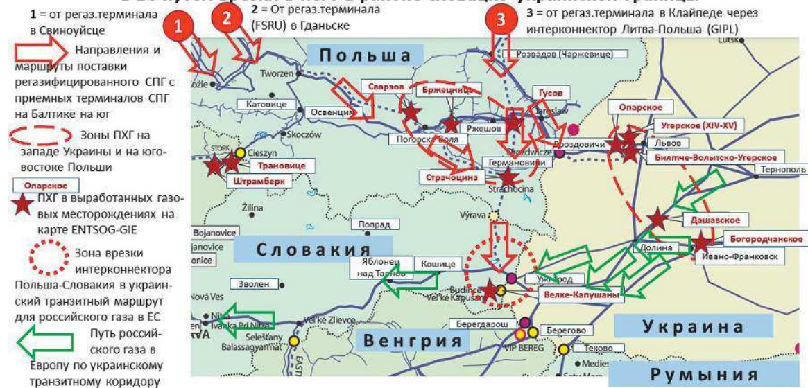
Организация поставок американского СПГ в Европу и использования украинской ГТС для фактического вытеснения российского газа. Схема автора

ризацией которой является расширение зоны евро с 2000 года. Это отчасти дает ответ на вопрос, почему США немедленно, с приходом Байдена, в первый-второй день его президентства, вернулись в Парижское соглашение. И начали гонку на опережение в развитии зеленой энергетики с ЕС. Одна из задач – не допустить, чтобы ЕС вырвался вперед, развивая рынок зеленой энергетики на основе евро. А именно такая цель была прямо сформулирована, например, в Водородной стратегии ЕС от 8 июля 2020 года.