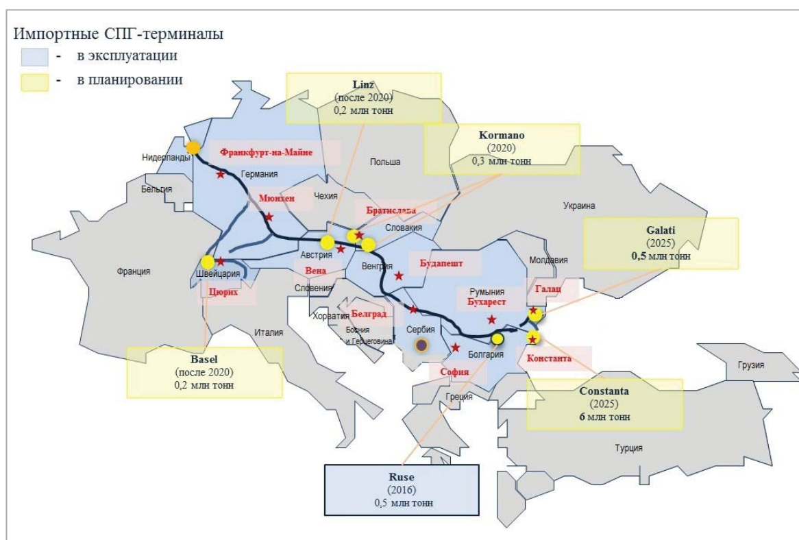
Рис. 2. Инфраструктура СПГ в Дунайском регионе

Особенно интересен опыт применения СПГ в качестве экологического «зеленого» топлива крупными круизными компаниям в связи с тем, что существует риск получения запрета швартовки «грязных» круизных лайнеров в портах популярных у туристов европейских городов. В случае, если решения об ограничениях к допуску в европейские пассажирские порты судов с вредными выбросами будут приняты соответствующими региональными властями, вся круизная индустрия рискует оказаться если не под ударом, то по крайней мере перед серьезным выбором в использовании топлива для своих судов. Это окажет достаточно большое благотворное влияние как на развитие инфраструктуры бункеровочного СПГ, так и на ускорение модернизации существующего круизного флота и строительство новых круизных лайнеров, использующих СПГ в качестве топлива. Что, в свою очередь, станет существенным экономическим толчком для строительства